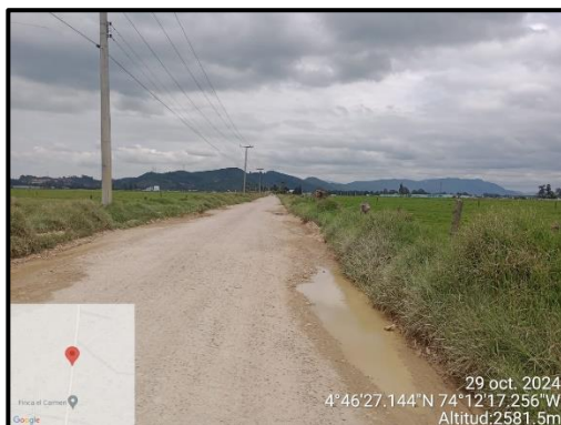
Ilustración 2. Evidencia recorrido, punto 1

Adicional a ello, en los puntos 1, 2, 4 y 5 no se evidenciaron anomalías que afecten el componente ambiental propio del recorrido de control y vigilancia en la vereda El Cacique, como se observa en las siguientes ilustraciones: