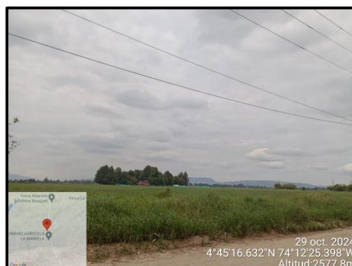
Ilustración 5. Evidencia recorrido, punto 5.