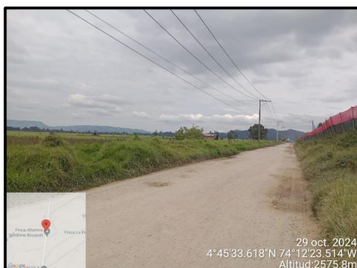
Ilustración 4. Evidencia recorrido, punto 4