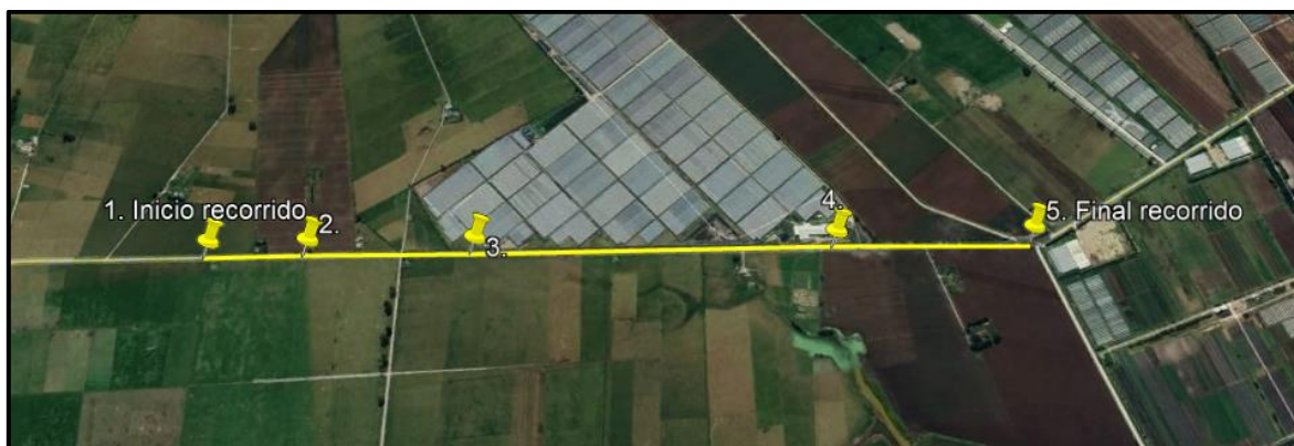
Ilustración 1. Recorrido de control y vigilancia en la vereda El Cacique.

Con base en lo anterior, el día 29 de octubre de 2024 se realizó recorrido de control y vigilancia en la vereda El Cacique desde las coordenadas 4°46'27.144"N – 74°12'17.256"O hasta las coordenadas 4°45'16.632"N – 74°12'25.398"O (ver ilustración 1. Ruta amarilla)